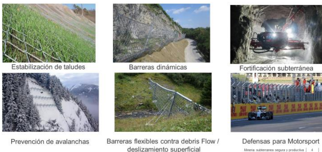
IMAGEN 2: Mecanismos de protección

Según ilustra la imagen siguiente, la sociedad se especializa en la fabricación y comercialización de sistemas de protección en contra de riesgos naturales a base de mallas de acero de alta resistencia, los que en Chile incluyen sistemas de estabilización de taludes, barreras dinámicas, fortificaciones subterráneas, barreras superficiales flexibles, entre otros (con excepción de barreras de protección para circuitos automovilísticos). Muchos de ellos actualmente son fabricados por la planta de Geobrugg Andina ubicada en Rancagua.