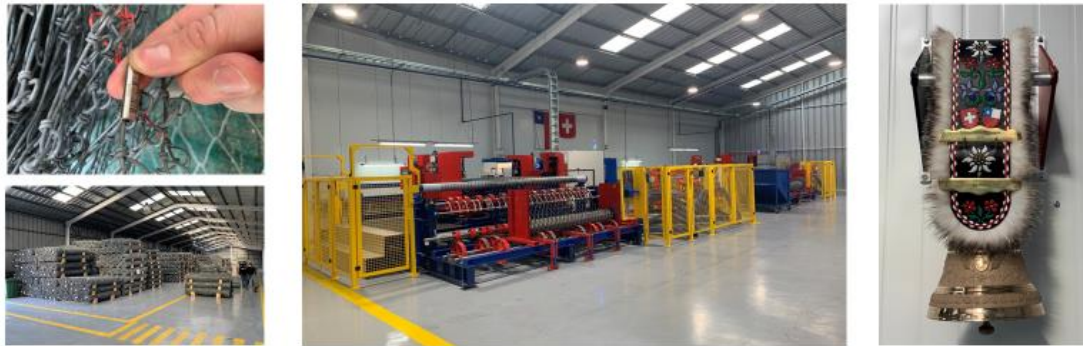
IMAGEN 1: Fábrica en Rancagua, Chile