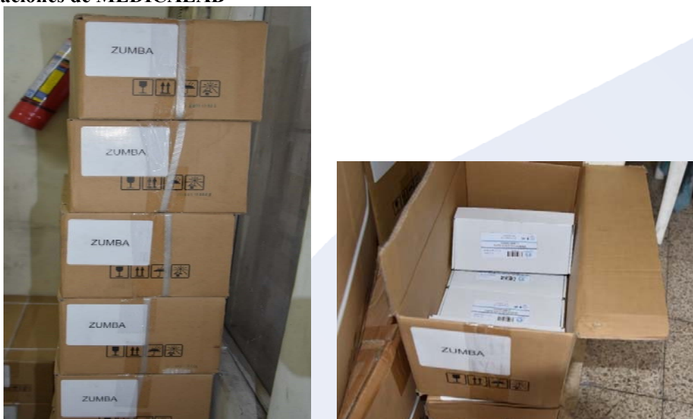
Imagen No. 1.- Cajas de insumos médicos de LABORATORIOS ZUMBA en las instalaciones de MEDICALAB

Fuente: Expediente No. SCPM-IGT-INICAPMAPR-008-2019, allanamiento al operador económico MEDICALAB.