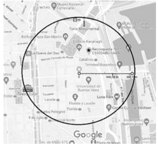
(f) Av. Pueyrredón 1663. VILLACH S.R.L.